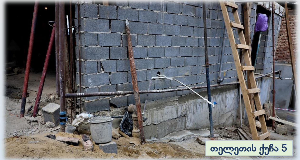
თელეთის ქუჩა 5