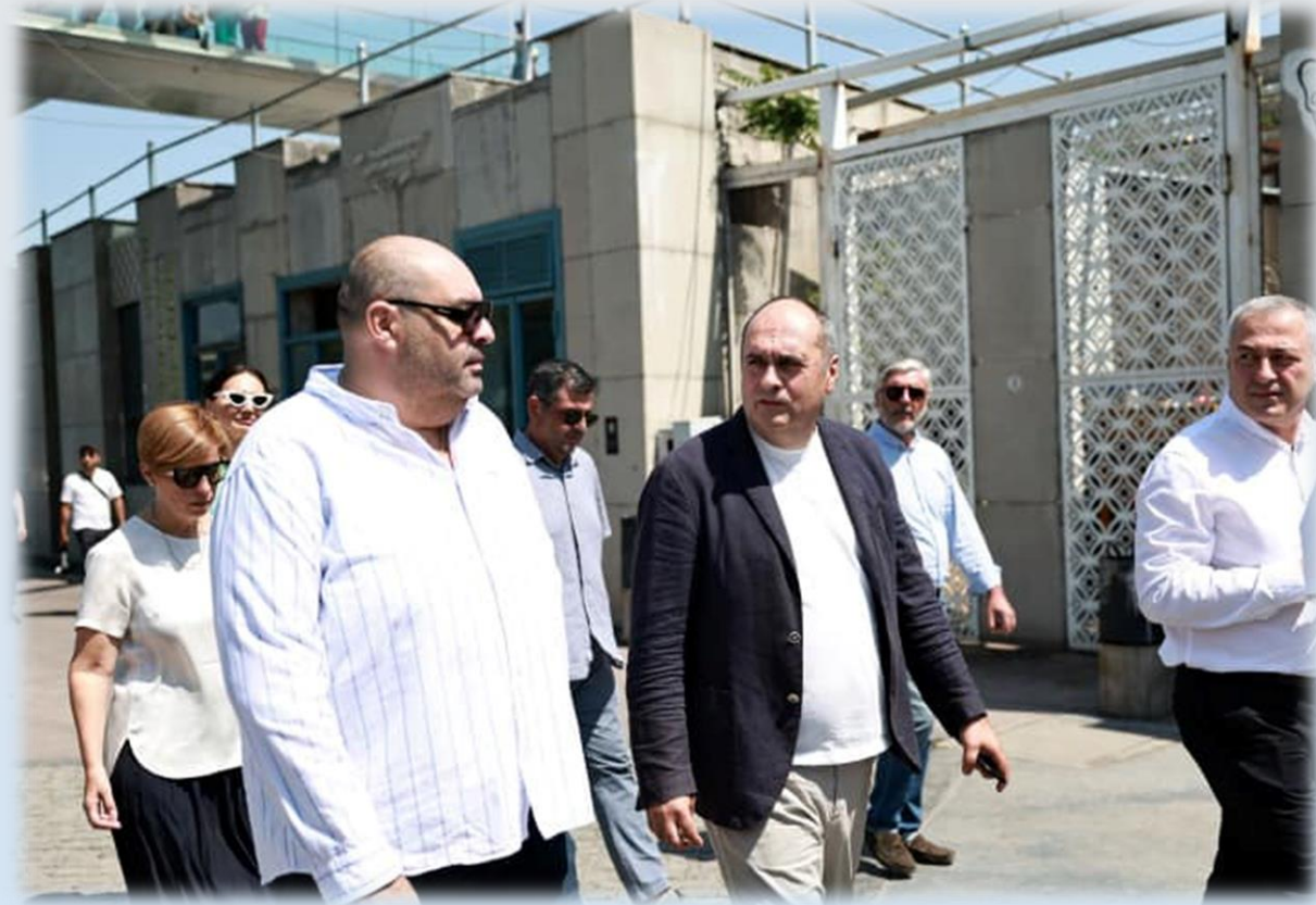
რეაბილიტირდა „მშვიდობის ხიდი“