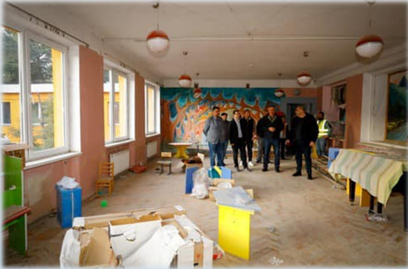
71-ე საბავშვო ბაგა-ბაღის კაპიტალური რეაბილიტაცია მიმდინარეობს