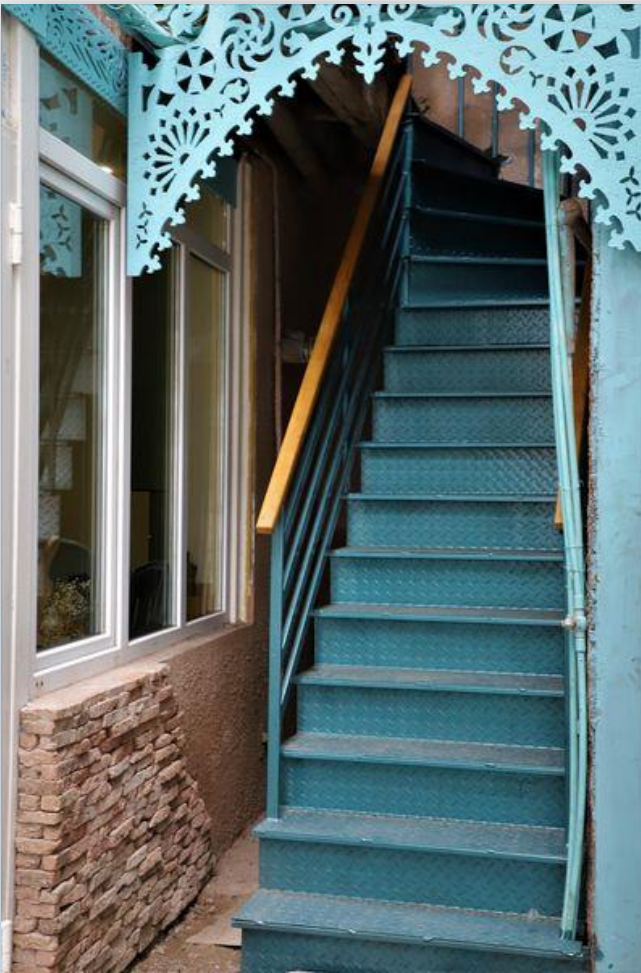
კიბის, კარისა და ჭიშკრის რეაბილიტაცია