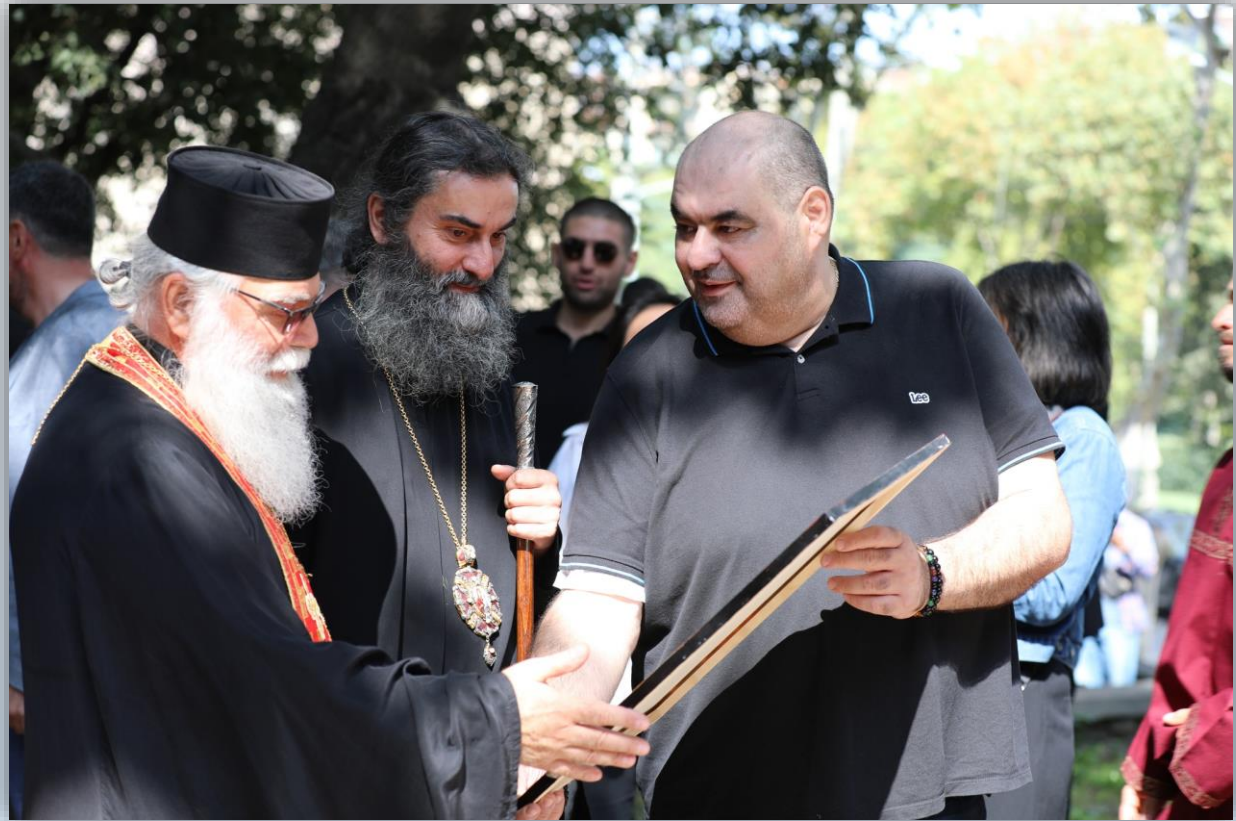
ღონისძიება კრწანისის ველზე გაიმართა