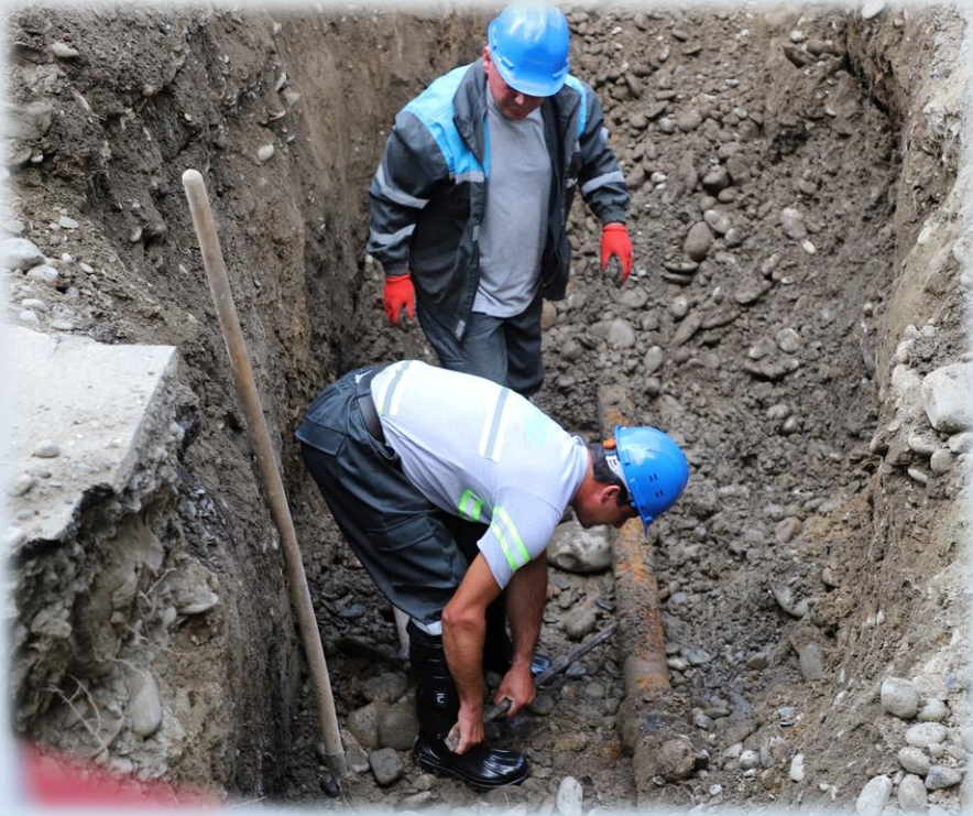
ფონიჭალაში, სვანების დასახლებაში, მიმდინარეობს წყალარინების ქსელის მოწყობა, რომლის ღირებულება 2 469 033 ლარია;