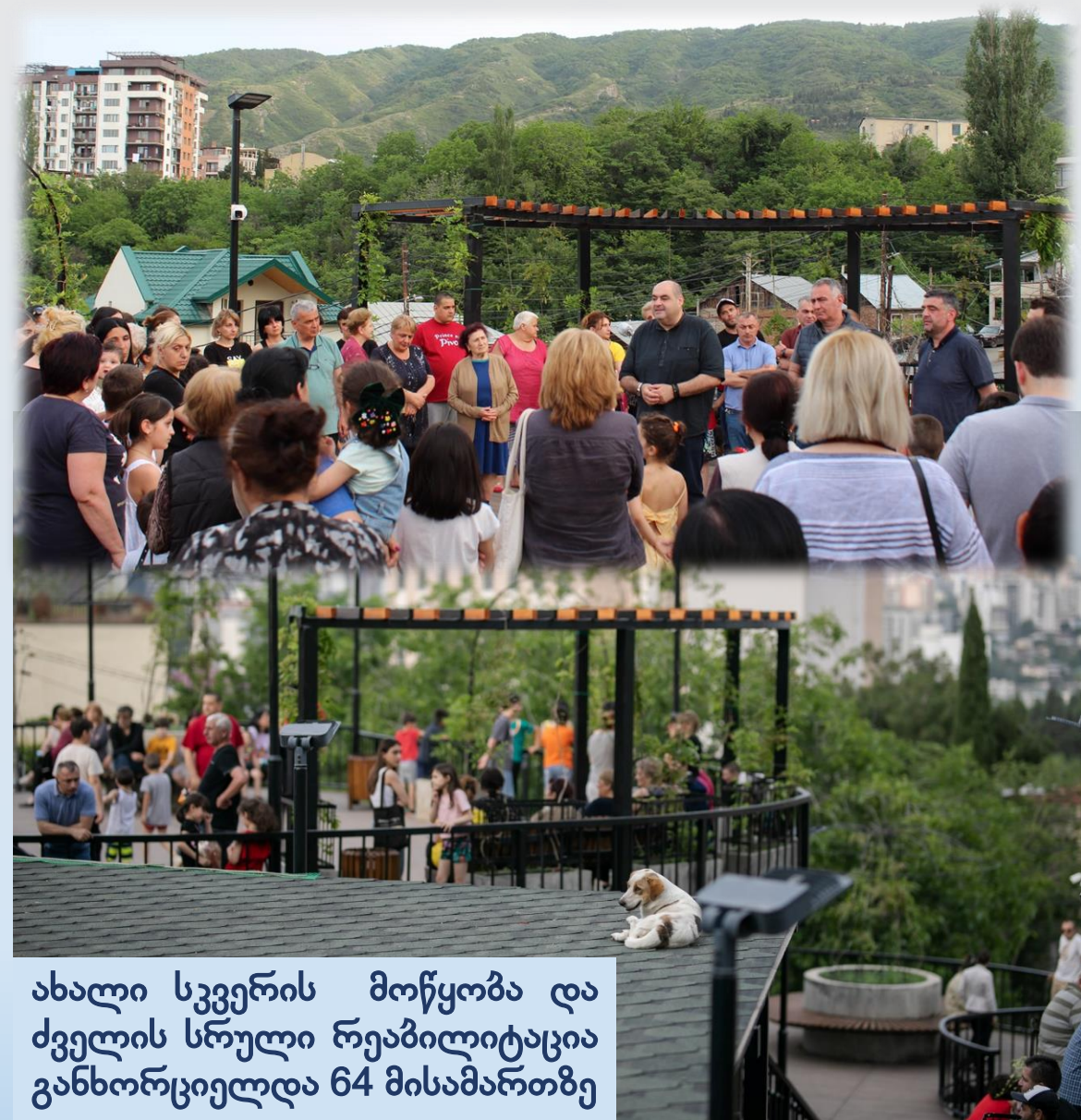
ახალი სვერის მოწყობა და ძველის სრული რეაბილიტაცია განხორციელდა 64 მისამართზე