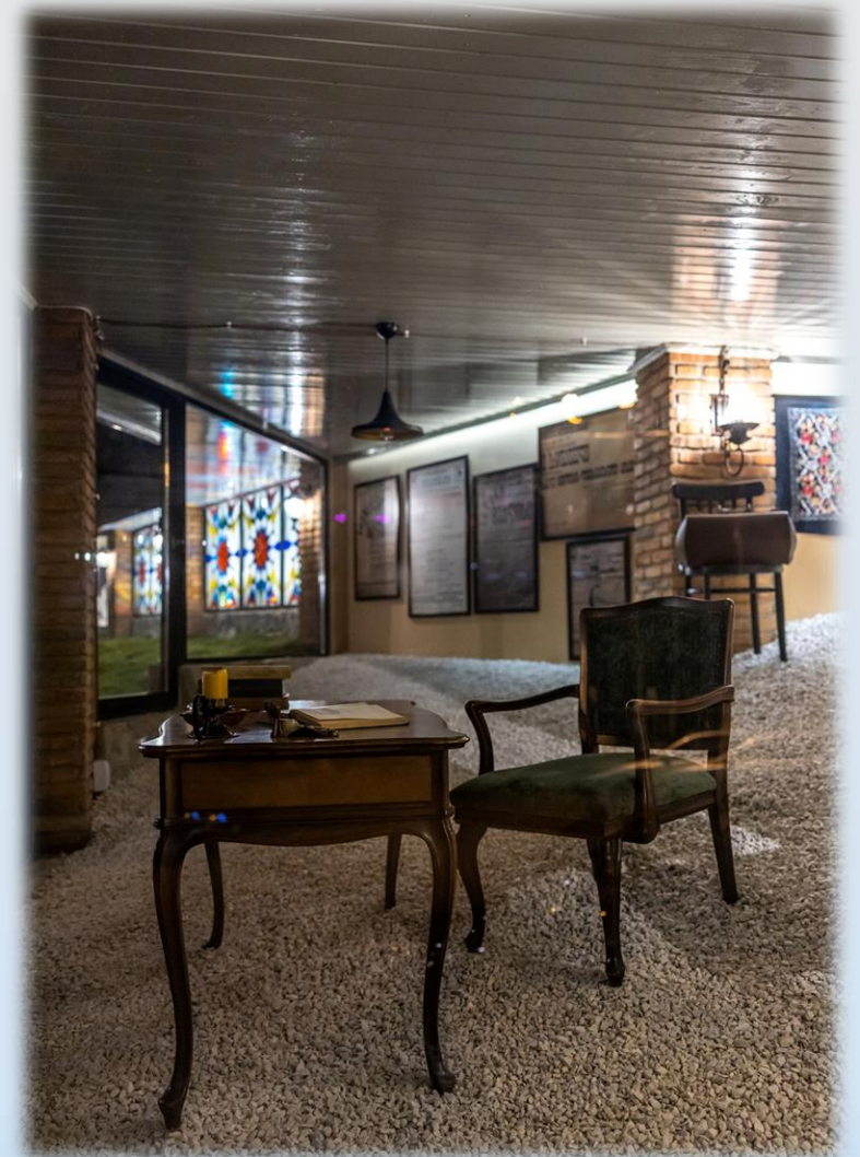
ღონისძიება იოსებ გრიშაშვილის სახელობის ღია მუზეუმის გახსნით დაიწყო