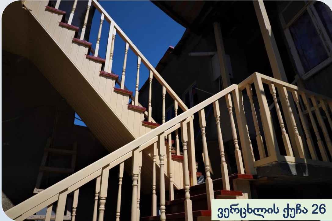
ვერცხლის ქუჩა 26