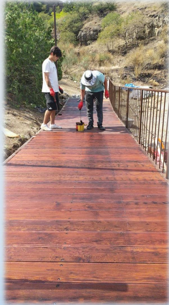
თაბორის მთის ტერიტორიაზე მიმდინარეობს დასასვენებელი სივრცის და საფეხმავლო ბილიკის მოწყობა, რომლის ღირებულება 767 700 ლარია;