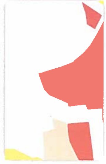
კორექტირებადი ფაქციური ზონის კონტური