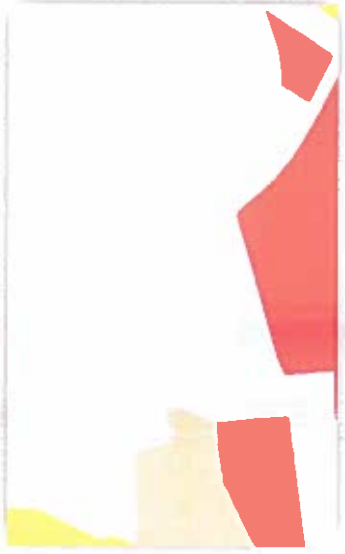
არსებადი ფაქციური ზონის კონტური